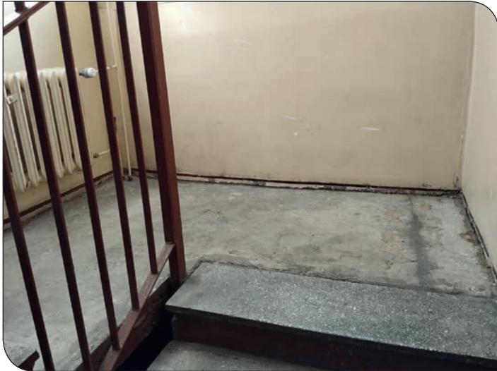
Tęczowe 16 - przed remontem klatki schodowej