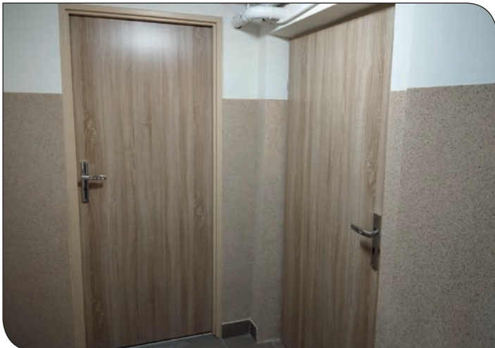
Błękitne 20 - po remoncie klatki schodowej