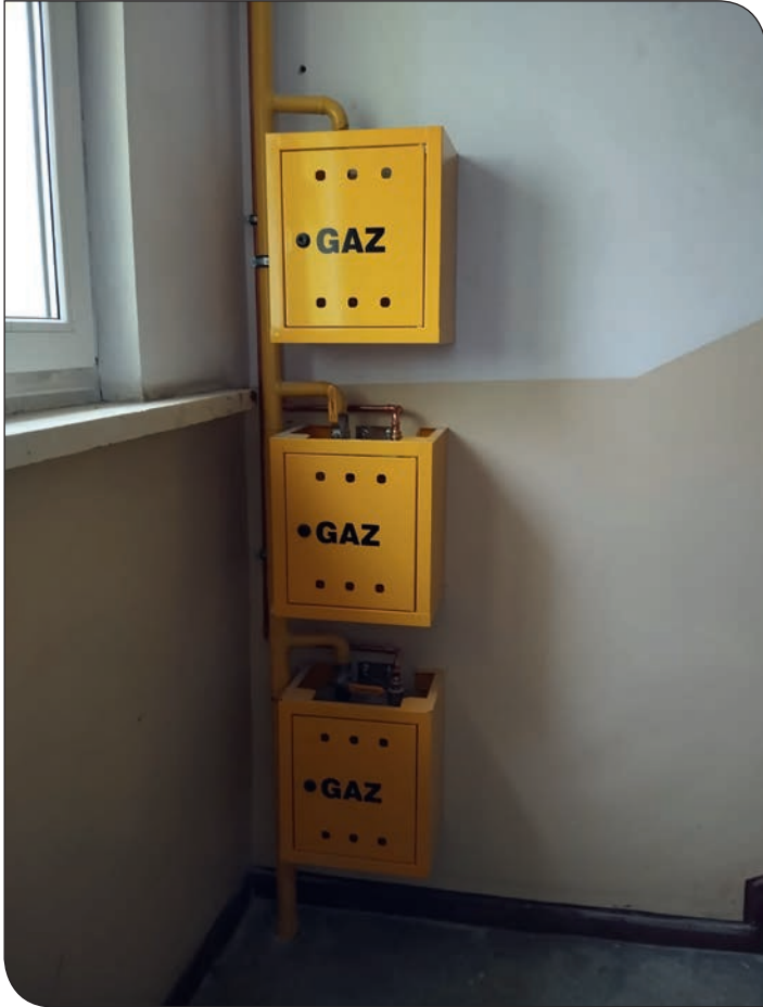
Błękitne 17 - po wymianie instalacji gazowej