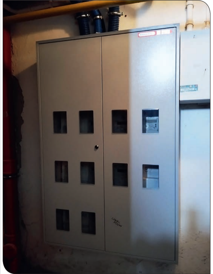
os. Tęczowe 5 po wymianie nowej instalacji elektrycznej