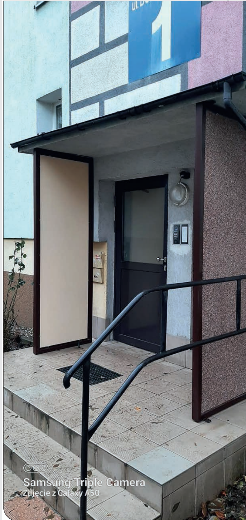
Budowlanych 1 - remont ganku