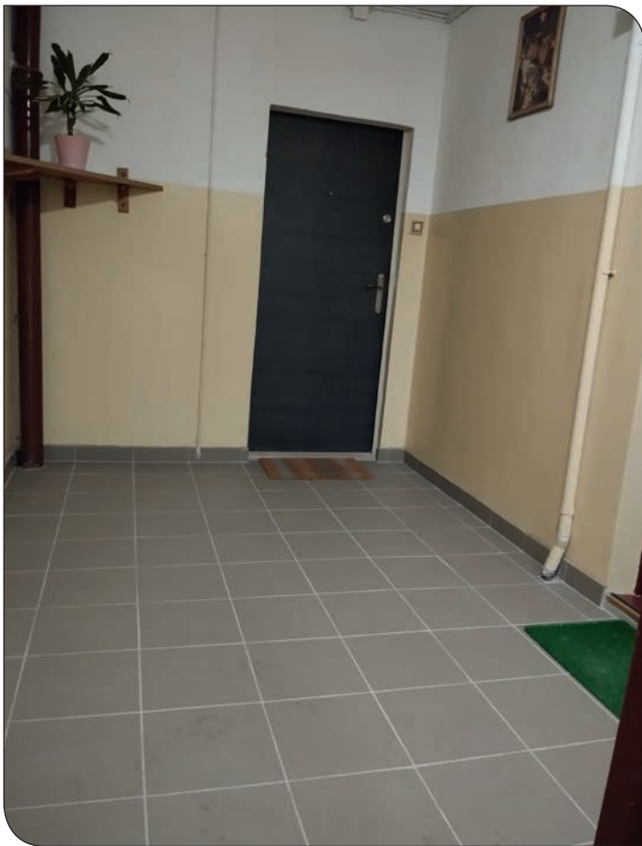
Tęczowe 12 po remoncie klatki schodowej